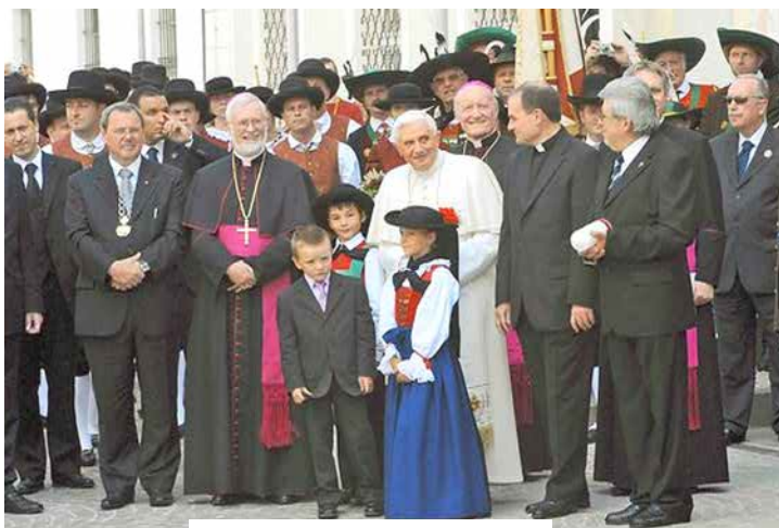
Papst Benedikt XVI. in Brixen

Wenn ich in vergangenen Zeiten vom Norden her über die Brennerstrasse nach Brixen gefahren bin, war es für mich immer ein bewegendes Augenblick, wenn sich dann das Tal öffnete und die Türme von Brixen sichtbar wurden – diese Stadt, umgeben von Wein- und Obstgärten, eingebettet zwi-