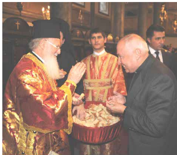
Der Ökumenische Patriarch übergibt unserem Pfarrer das Antidoron

Unser Pfarrer war auch diesmal zum Andreasfest in Konstantinopel und hatte wiederum die Gelegenheit, am Festtag nach der heiligen Liturgie und beim abendlichen Empfang dem Ökumenischen Patriarchen zu begegnen. Eine Gesprächsmöglichkeit ergab sich auch mit Kurienkardinal Koch.