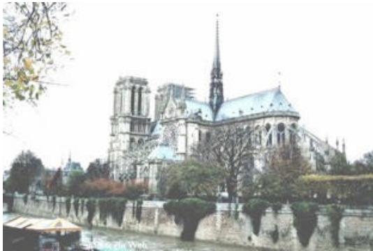
Notre Dame de Paris

„Damals fing ich zu schriftstellern an und hatte die Vorstellung, ich könnte in den katholischen Zeremonien, die ich mit dünnkelhaftem Dilettantismus betrachtete, ein geeignetes Reizmittel und den Stoff für ein paar dekadente Übungen finden. In dieser Stimmung wohnte ich, von der Menge gestoßen und gedrückt, dem Hochamt mit mäßigem Vergnügen bei. Dann, da ich nichts Besseres zu tun hatte, kam ich zur Vesper wieder hin. Die Knaben der Singschule in weißen Gewändern sangen gerade, und die Schüler des kleinen Seminars Saint Nicolas-du-Chardonnet, die ihnen dabei zur Seite standen, hatten eben, wie ich später erfuhr, das ‚Magnificat‘ angestimmt. Ich selbst stand unter der Menge in der Nähe des zweiten Pfeilers am Choranfang, rechts auf der Seite der Sakristei. Da nun