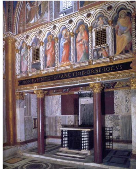
Kapelle Sancta Sanctorum

Der Höhepunkt unserer Pilgerreise war gewiss am Epiphaniestag die Feier der hl. Messe mit Papst Benedikt XVI. in der Petersbasilika. Schon früh machten wir uns auf den Weg. In der festlichen Messfeier sagte der Hl. Vater in seiner Predigt: „Das Licht, das zu Weihnachten erscheint und sich heute allen Völkern offenbart, ist die Liebe Gottes, die in der Person des Fleisch gewordenen Wortes Gestalt angenommen hat“. Sogleich nach dem Angelusgebet und dem Segen, den der Hl. Vater von seinem Fenster aus im Apostolischen Palast spendete,