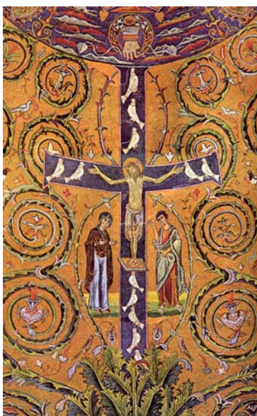
Apsismosaik in San Clemente