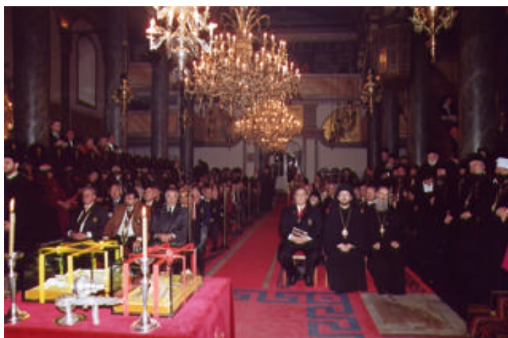
St. Georgskirche, Ökumenisches Patriarchat, im Vordergrund die Reliquienschreine.

Schon zur ersten Vesper des Andreasfestes waren die Reliquien zur Verehrung der Gläubigen ausgestellt. Außer den Mitgliedern der Heiligen Synode des Ökumenischen Patriarchats und orthodoxen Christen aus der Türkei, aus Griechenland und Amerika, hatten sich auch mehrere katholische Bischöfe zu dieser Feier eingefunden.